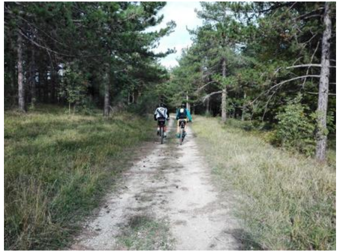
Verso Monte Scopo