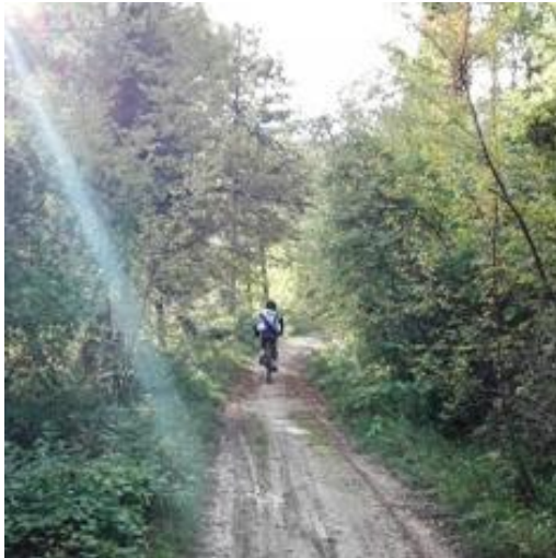
Salita verso Monte Romanino