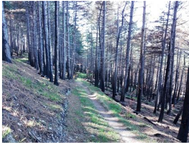
I boschi delle Cesane