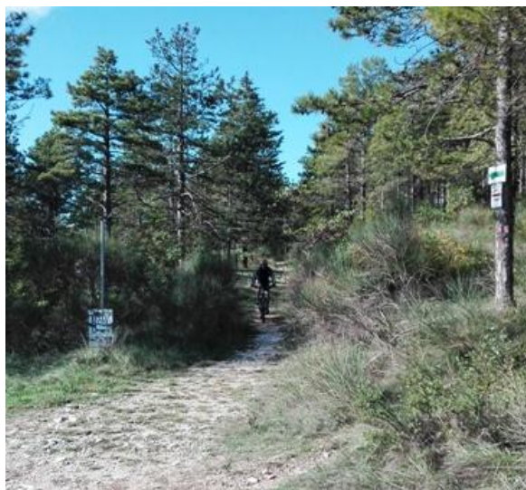
Discesa su trail