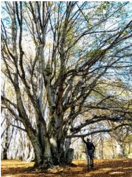
Faggeta di Canfai