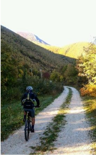
Salendo da Frontale verso Pian dell'Elmo