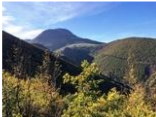
Il Monte San Vicino in autunno