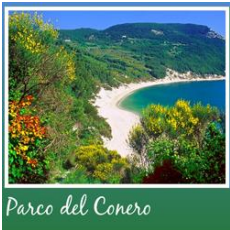
Parco del Conero