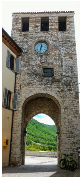
La torre civica di Costacciaro