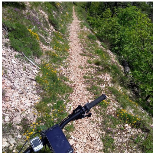
Sentiero n.293, meglio conosciuto come "Lo Schioppo"