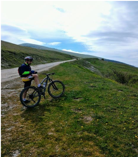
Verso Pian di Spilli