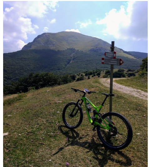
Il versante nord del Monte Cucco da Pian delle Macinare