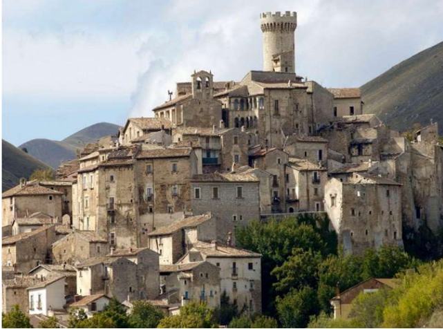
Santo Stefano di Sessanio