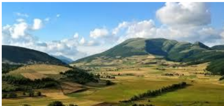
Altopiani di Colfiorito (o Altopiani Plestini )