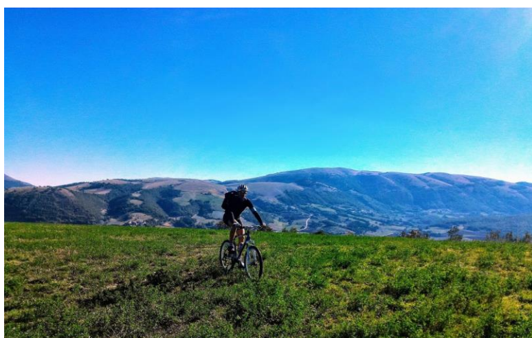
Sulla cima del Monte di Cupigliolo