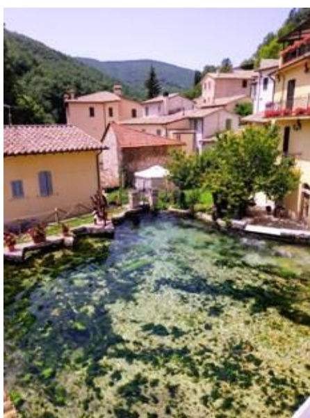
Rasiglia, il Borgo dei Ruscelli