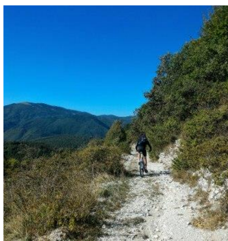
In discesa verso Rasiglia