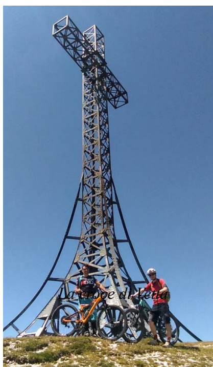
La croce di vetta