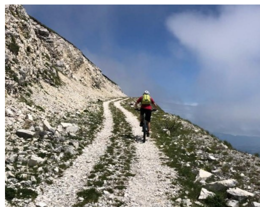
L'ultimo tratto della lunga salita