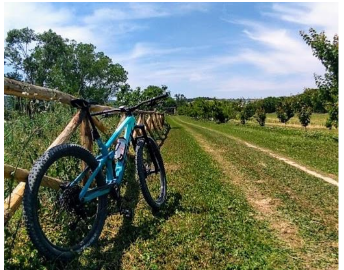
Lungo i Piani d'Aspio