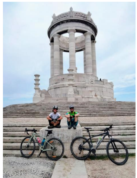
Gli accompagnatori al Passetto