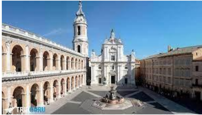
Loreto, luogo di partenza dell'itinerario