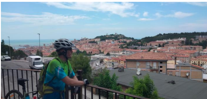
Ancona dal colle del Pincio