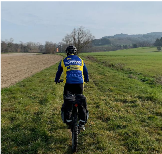
Valle del Boranico