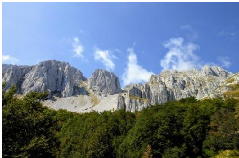
Le balze del Sirente