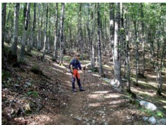
La bella faggeta nella Valle del Condotto