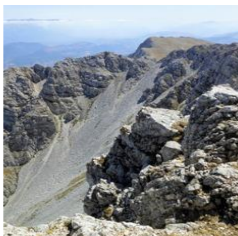
Canale Maiori (o Valle Inserrata)