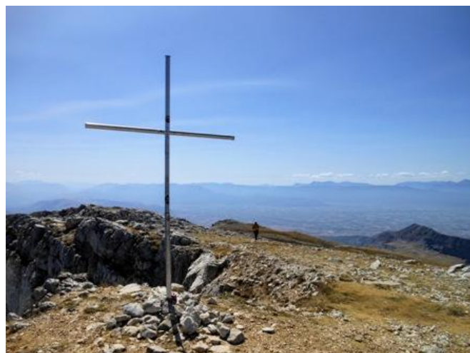
Cima del Monte Sirente